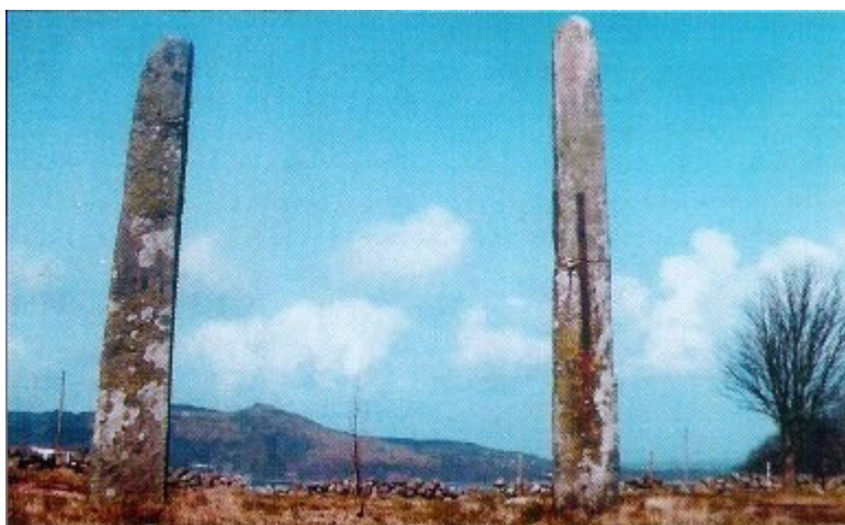
På toppen av øya, med Rennesøyhornet i bakgrunnen finnes disse steinstøttene, kalt «Pighedlene» hvor et gammelt sagn forteller at dette er gravhaug etter to småkonger.

mot veien som fører ut mot moloen ved Melingsjøen, som forøvrig er badeområde for fastboende og feriefolk, med en flott sandbanke, men også mulighet for dypere vann. Dette feltet er lite, men der finner arkeologene interessante sammensetninger av ulike motiv som var særlig utbredt i bronsealderen. Figurene her er mest in natura, og ikke malt opp, slik de er på felt 1.