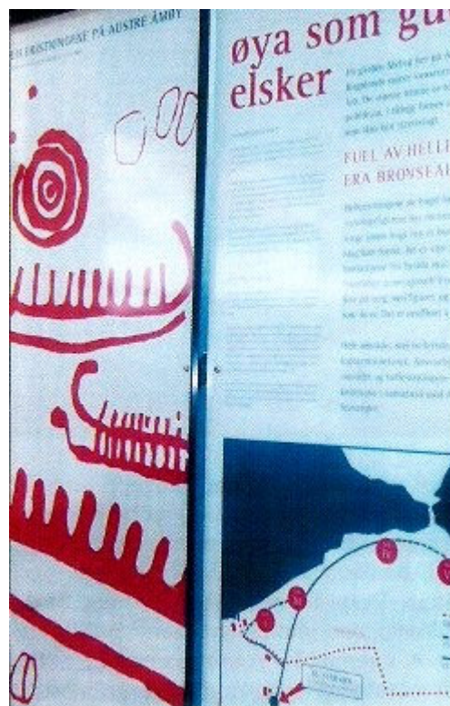
Denne informasjonstavlen finner du ved første vei til høyre etter å ha passert Åmøy kapell.