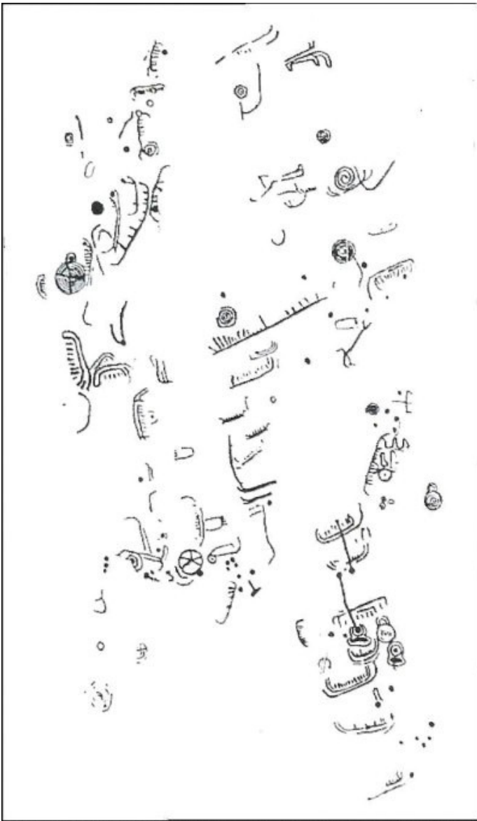
Helleristningsfelt fra Nedre Tasta i skråningen ned mot Stokkavannet.